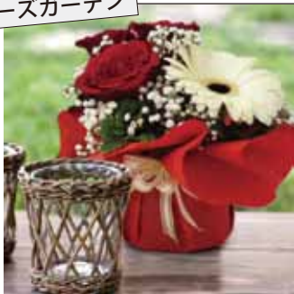
新フラワーラップ ローズガーデン

その他、リード商事オリジナルの正月飾りなど、年末から年明けに向けての商材も紹介いたします。当社のフラワー資材販売店舗「east side tokyo (イーストサイドトーキョー)」のコーナーでは、ショップやオフィスでのグリーンディスプレイによる空間演出の事例を紹介いたします。またレジ袋有料化に代表される環境問題への対応として、環境対応素材で製造したレジ袋など、当社が取り組む環境対応商品も併せて紹介いたします。