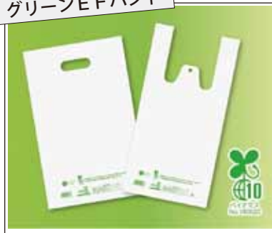
環境対応商品 グリーンE Fハンド