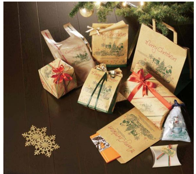
新商品 [クラシカルノエル]

今年のクリスマス向けトータルシリーズの新商品です。クラシカルな雰囲気をお楽しみください。