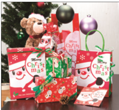
新柄クリスマス包装資材