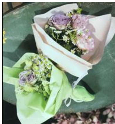
フラワーラップ [レインボーシート]