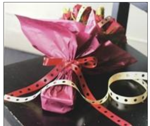
花束用リボン [ドットリボン]