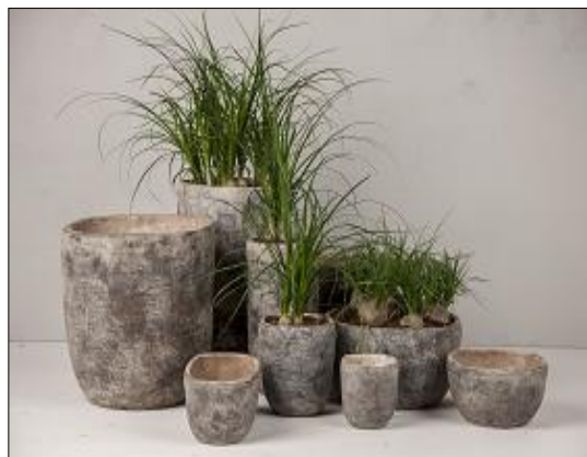
D&M depot [陶器クラウドシリーズ]