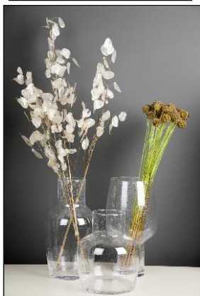
ハックルベル[ガラスベース]